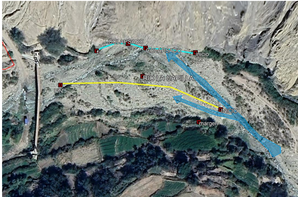
5.- IMAGEN SATELITAL DE ZONA VULNERABLE