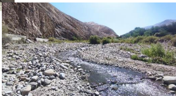
Derecha de imagen , material acumulado en margen izquierda