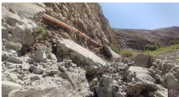
TRAMO DE CANAL COLAPSADO